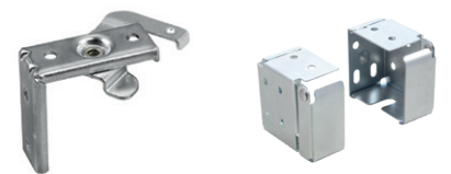
typ A - universal (standard)