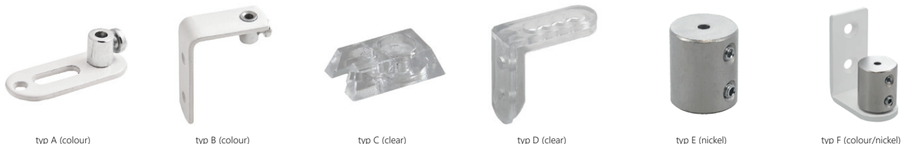
typ A (colour)