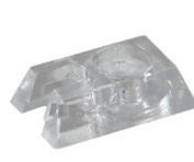
typ C (clear)