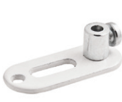
typ A (colour)