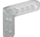
typ D (clear)