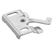
typ B - tekmontering