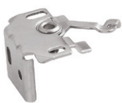
typ A - universal (standard)