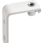
typ B (colour)