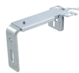
typ D - installbar 80/120 (zinc coated/colour)