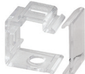
typ C (clear/white)